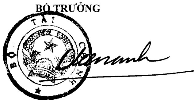
Đinh Tiến Dũng