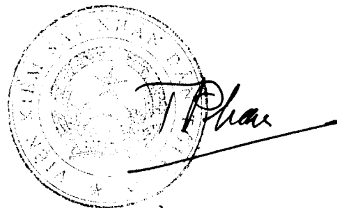
Trần Công Phàn